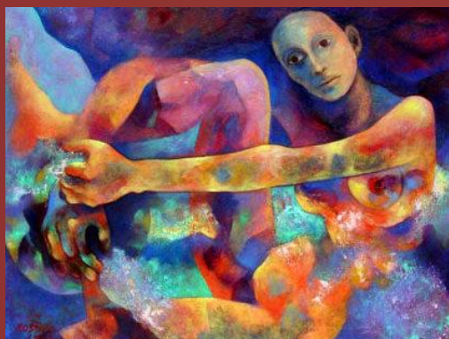
Rosario Gutierrez Mares "Descubrirás que tu cuerpo era todo el Universo" Oleo sobre temple